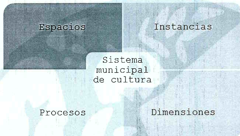
Ilustración 1. Estructura del sistema municipal de cultura.

En el ámbito municipal, según las facultades otorgadas para tal fin por el decreto nacional 1080 de 2015, la acción pública sobre la cultura debe ser organizada en torno al sistema territorial de cultura que tiene las mismas funciones y objetivos que el SNC'u, de tal manera que quien lo coordina es la Dirección de Cultura de la Secretaría de Desarrollo Social.